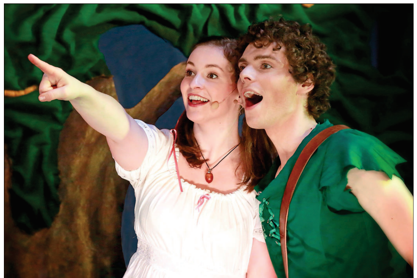
Peter Pan und seine Freunde bringen ihre Abenteuer im traumhaften Nimmerland auf die Bühne im Theater am Hagen.