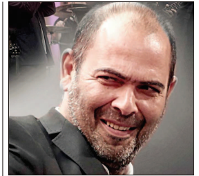
Hannes Ringlstetter gastiert am 7. April im Markmiller-Saal.

Viele Flüchtlinge aus Zentralafrika nähmen die Gefahren der Wüs-